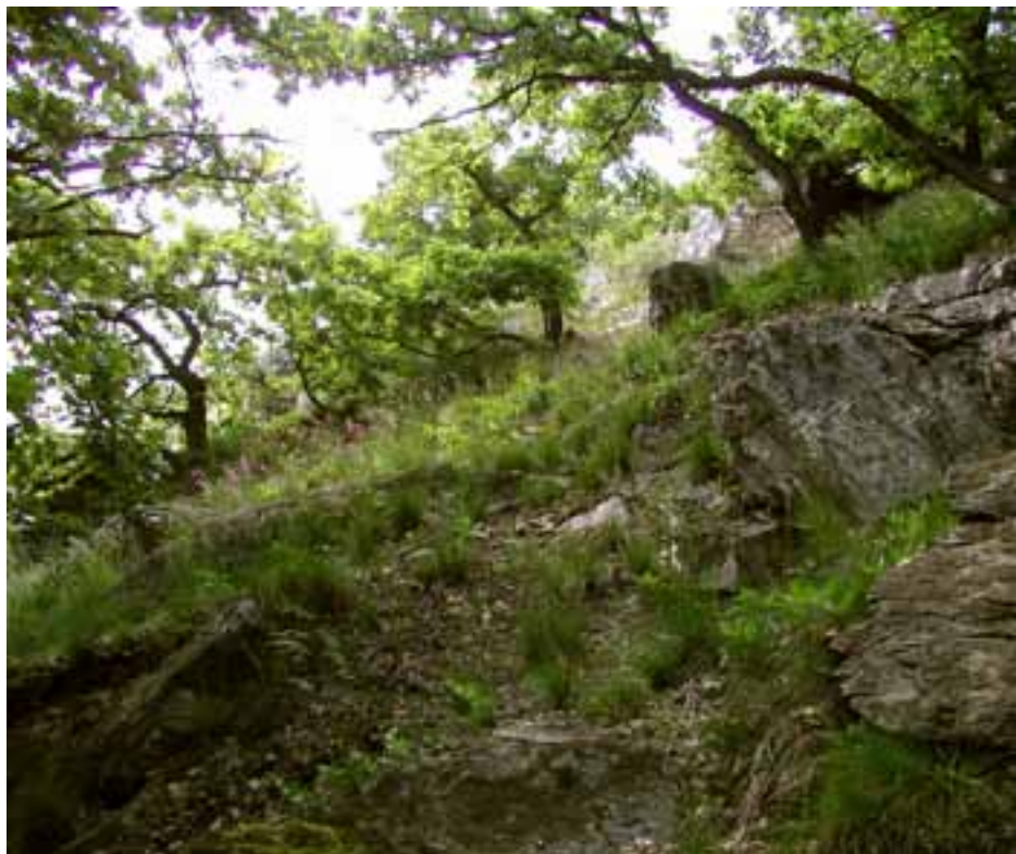
Kyslá dubina na Zobore