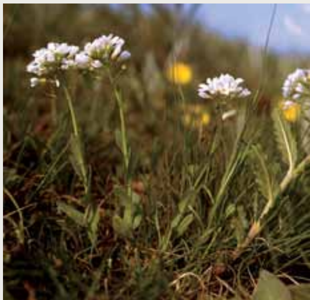
Peniažtek slovenský ( Thlaspi jankae )