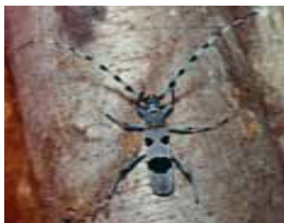
Fuzáč alpský ( Rosalia alpina )

Z európsky významných druhov živočíchov tu môžeme nájsť: v bučinách severných svahov chrobákov fuzáča alpského ( Rosalia alpina ), v dubinách fuzáča veľkého ( Cerambyx cerdo ) a roháča obyčajného ( Lucanus cervus ). Na prítomnosti vody sú závislé kunka žltobruchá ( Bombina variegata ) a kunka červenobruchá ( Bombina bombina ). Pri troche šťastia možno na jar stretnúť jaštericu zelenú ( Lacerta viridis ), samec tohto druhu je v čase rozmnožovania krásne sfarbený. Na skalách a v jaskyniach majú domov netopiere lietavec sťahovavý ( Miniopterus schreibersii ) a netopier obyčajný ( Myotis myotis ).