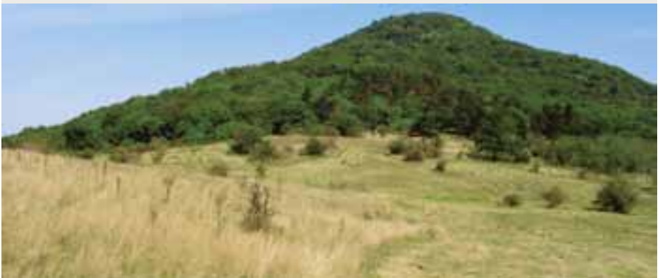
Vykosené lúky pod Žibricou (PR Žibrica)