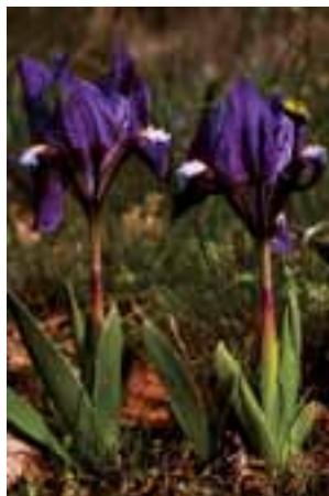
Kosatec nízky ( Iris pumila )