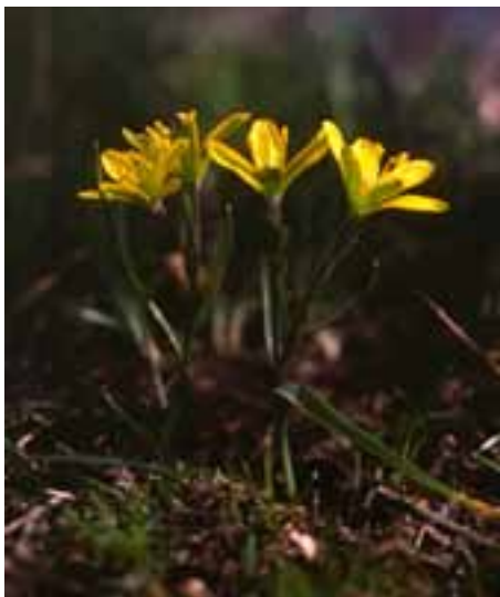
Krivec český (Gagea bohemica)