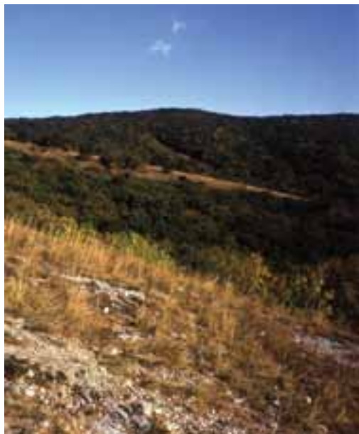
Prírodná rezervácia Zoborská lesostep