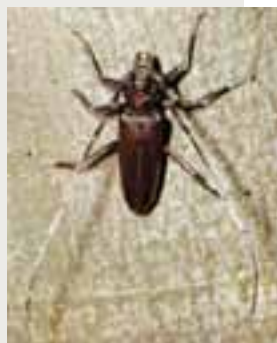
Fuzáč veľký ( Cerambyx cerdo )