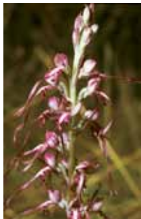
Jazýčkovec východný ( Himantoglossum caprinum )

včlenená do nitrianskej mestskej aglomerácie (cca 100 000 obyvateľov), je značná časť záujmového územia celoročne ovplyvňovaná aktivitami súvisiacimi s krátkodobou turistikou. K najagresívnejším patrí neorganizovaná cykloturistika a motokros. Ďalším problémom je narastajúci tlak na vyťaženie zásob nerastných surovín nachádzajúcich sa v severozápadnej časti Zoborských vrchov. Ak by nebola ťažba vápenca v tejto časti územia regulovaná príslušnými orgánmi mohla by spôsobiť fyzický a nenávratný zánik niektorých aj európsky významných biotopov.