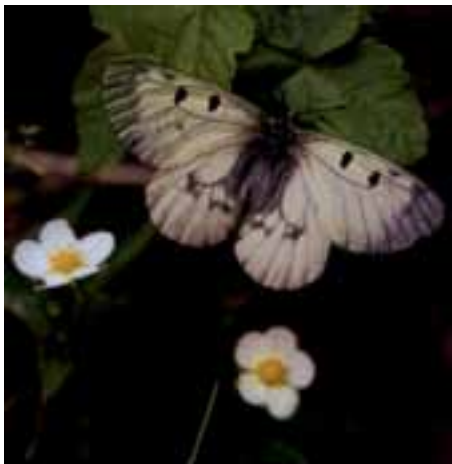
Jasoň chochlačkový (Parnassius mnemosyne)

Sformulovaniu programu starostlivosti s navrhovanými opatreniami bude predchádzať ich prerokovanie so zainteresovanými vlastníkami a užívateľmi územia. Nezávisle na tomto procese môžete s otázkami a návrhmi už teraz kontaktovať pracovníkov Správy Chránenej krajinej oblasti Ponitrie.