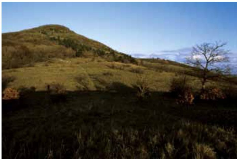
Lúky pod Žibricou