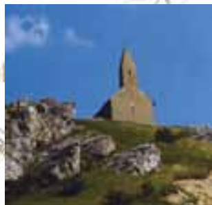
Skalky pod kostolikom sv. Michala nad Dražovcami