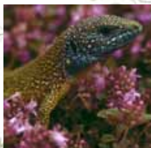
Jašterica zelená ( Lacerta viridis )