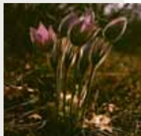
Poniklec veľkokvetý ( Pulsatilla grandis )