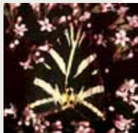
Spriadač kostihojový ( Callimorpha quadripunctaria )