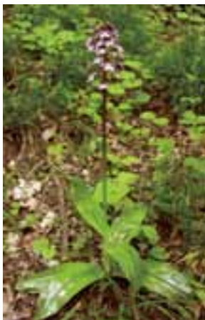
Vstavač purpurový ( Orchis purpurea )